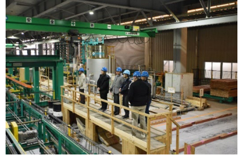
●銘建工業株式会社 CLT工場での様子

*当社・院庄林業株式会社・ポラテック株式会社・銘建工業株式会社は、日本の木造技術や木材利用技術の海外普及を目的として2023年に発足した日本木造建築海外推進協議会 ( https://jtop.link/ ) の理事をつとめており、中国木材株式会社は会員へ加入しています。