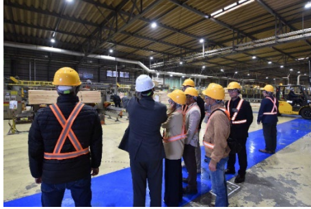
●院庄林業株式会社 岡山工場での様子